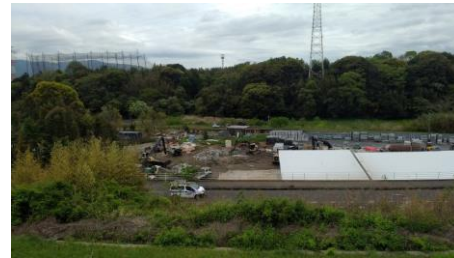
(横尾地区の産廃場)

大分市東部地区のお住まいの方から、2月から宅地下の道路横に産廃処分場ができて、「おこり・騒音に悩ま