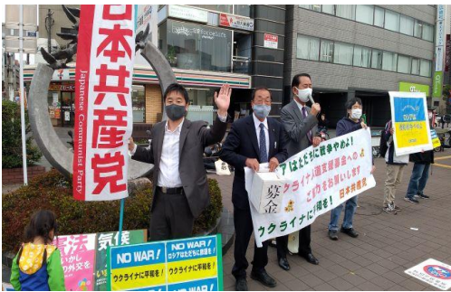
(毎週月曜日の駅前宣伝)

ロシアのウクライナへの軍事侵略も2か月が経過しました。罪のない市民への虐殺に心を痛め、憤りを禁じ得ません。