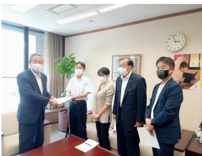
(緊急要望する党と議員団)

8月1日、党中部地区と党市議団は、急拡大するコロナから、市民の命と暮らしを守る16項目の緊急要望を副市長に届けました。