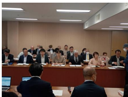
(協議する県下の地方議員など)

10月26日、大分県に提出した190項目余りの新年度要望に基づき、2班に分かれ、総務部・企画部・福祉保健部・商工労働観光部・土木建築部など、担当部局と協議をおこないました