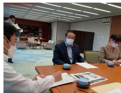
(市長に要望する福間)

参加者からは「日出生台日米合同軍事演習の情報公開を」「敷戸弾薬庫への長射程ミサイル保管庫新設中止と地域住民への説明会実施を」「消費税減税・インボイス中止を」「物価高騰対策」「線状降水帯による内水氾濫対策を」